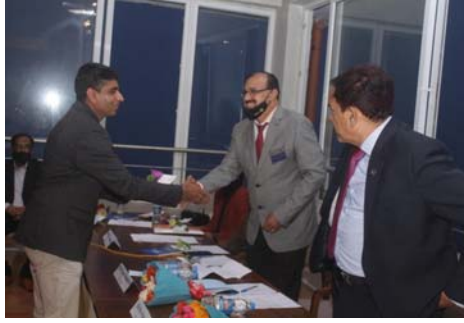
Rotary year 2021_22, "The first AG Designate ZS Designate Meeting held @ Madikeri, Glimpse of the meeting, & Handovering of Appointment letter to the Zonal Leaders